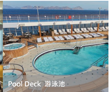
Pool Deck 游泳池