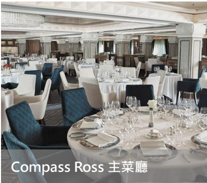
Compass Ross 主菜廳