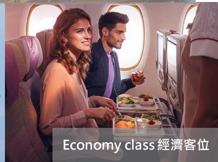
Economy class 經濟客位