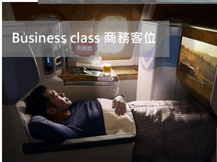
Business class 商務客位